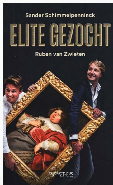
Elite gezocht, door Sander Schimmelpenninck en Ruben van Zwieten, uitgever Prometheus, 216 blz., prijs € 19,99.

Als de auteurs voortdurend verzuchten dat vroeger alles beter was, zou je bijna denken eerder te maken te hebben met ouden van dagen, aanhangers van PVV, FvD of 50+, dan met dertigers, die zeggen op D66 en GroenLinks te